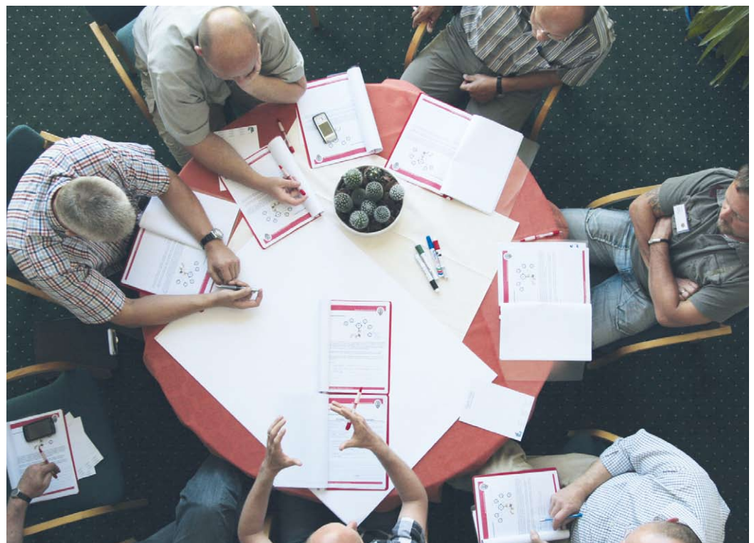
Med otte i hver gruppe var der plads til intense drøftelser, hvor argumenter blev vendt og drejet, inden de senere skulle forelægges for plenum.

Kommunerne kan enten drive det fælles kontrolrum som et fælleskommunalt § 60 selskab, eller de kan udbyde det, så det drives af fx en større kommune eller af en privat entreprenør.